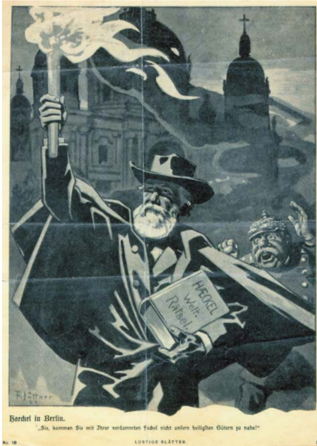
Abbildungen aus den besprochenen Bänden