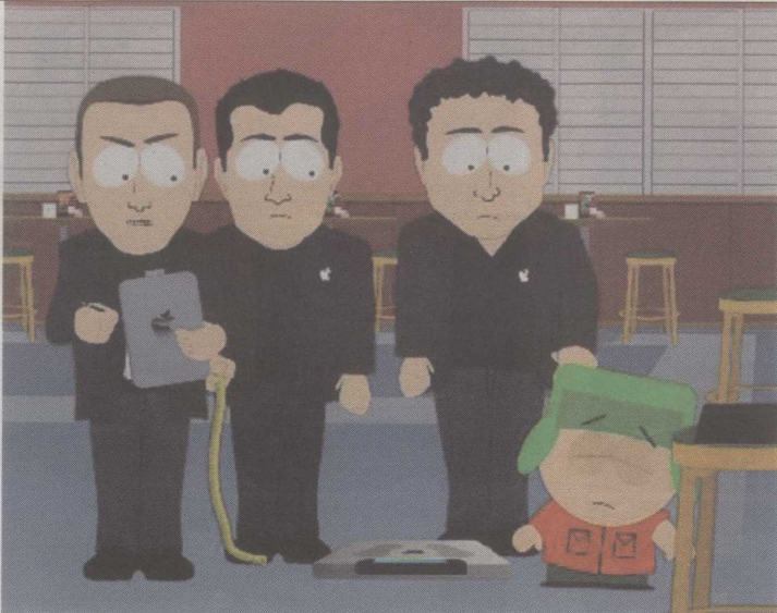
אנשי אפל חוטפים את קייל מ'סאות' פארק - לאחר שהסכים לכל תנאי השימוש

תראה את התנאים מראש. הסיבה, קבע השופט, היא שמדובר רק בעלויות עסקה, והגילוי הוא בזכו זמן ואף אחד לא קורא את זה. אבל משום שהוא הבין שאנשים כן צריכים לדעת את התנאים והזכויות שעליהם חתמו, הוא קבע שהחובה נכרת רק אחרי שהגעת הביתה ופתחת את הקופסה. לכן יש לך באופן טבעי את הזכות להחזיר. אני, כצרכן, קראתי את זה וחשבת 'הללויה'.